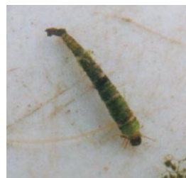
携巢性トビケラ (参考画像)