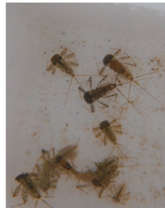
タニガワカゲロウ