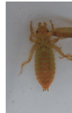
サナエトンボ(ヤゴ)